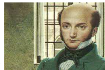
Louis de POTTER

Celui-ci étant titulaire du pouvoir exécutif, le Gouvernement provisoire lui remet sa démission.