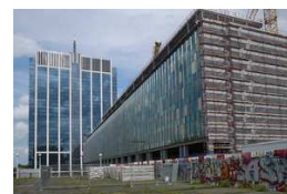
Ex-Cité administrative en 2016.

Les plans présentaient un bel espace, largement ouvert et arboré respectant totalement la perspective de la rue du Congrès. Cela aurait constitué un trait d'union de rêve pour désenclaver le quartier.