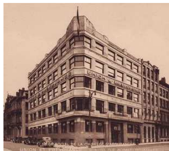
À gauche, l'entrée de l'im-passe de la Bobine est visible

Construit vers 1925, il a abrité à l'origine les bureaux de la Compagnie d'assurances Union et Prévoyance. Restauré et rénové récemment, il a été légèrement rehaussé et compte actuellement 7 niveaux d'élévation. Il est à présent occupé par Bruxelles Formation qui emploie un personnel considérable et accueille annuellement un nombre