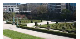
Jardins à la française au Botanique