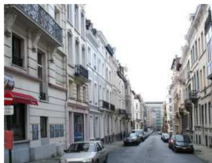
↑ Perspective descendante depuis la rue des Cultes.

Au n°19, magnifique portail. C'est l'extrémité d'un vaste immeuble dont la majeure partie est rue de l'Association. L'ensemble est occupé pas un important cabinet d'avocats fort réputé. Six niveaux d'élévation, plus un 7e (en décrochage) qui n'est guère visible que de l'intérieur de l'îlot. Ici pas d'habitants : c'est l'une de nos P.M.E.