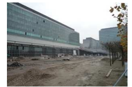
Cité administrative : destruction