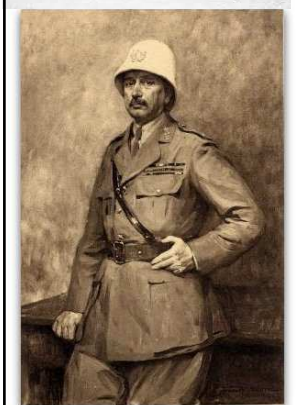
Bataille de la Somme