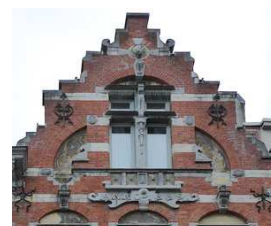
Pignon, sgraffites et très moche entrée cochère

Au n°21, ce qui aurait pu être une des plus belles façades néo-renaissance flamande du quartier (1899). Elle s'orne de plusieurs sgraffites, assez rares chez nous. Ils sont hélas en très mauvais état. En outre une très inesthétique entrée cochère défigure totalement le bas de l'immeuble. C'est l'accès aux véhicules de la F.S.M.A. dont l'entrée principale se trouve rue du Congrès (ce n'est pas apparent du tout).