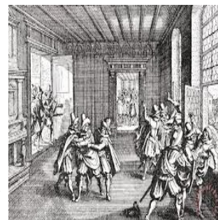
La fameuse défenestration de Prague.

Je suis à quelques centaines de mètres, je réponds que j'y vais et constate qu'au deuxième étage un individu est en train de défenestrer sa femme. Une patrouille arrive entretemps. Nous montons et intervenons avec la vigueur qu'exige la situation. Voyant son mari malmené, l'épouse du forcené se saisit d'une bouteille et la fracasse sur la tête d'un des agents. Les deux protagonistes seront emmenés au poste.