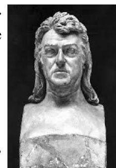
Surlet de Chokier

Une fois encore, ceci montre que les promoteurs de notre « nouveau quartier » ont bien été contraints de se rabattre sur ce qui restait, comme cet excellent Baron Erasme Surlet de Chokier, premier Régent de Belgique.