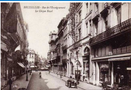
Rue et cirque, début XXe

« L'âme des Poètes », etc. Il est resté fidèle au Cirque Royal, où, après 43, il est revenu régulièrement en 47, 56, 87 et 93.